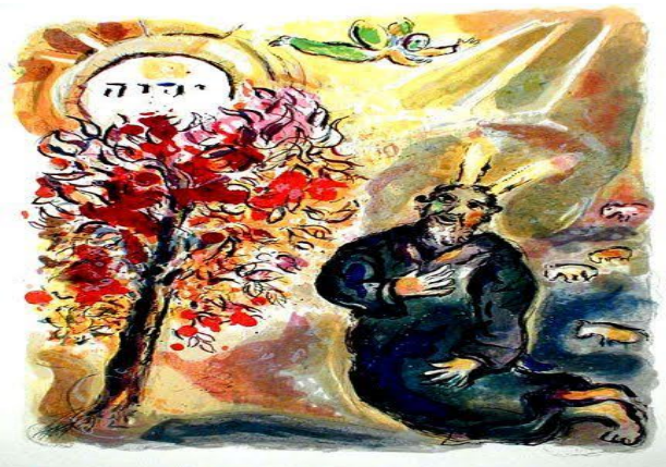
Gods verschijning aan Mozes in de brandende braamstruik, Marc Chagall (1887-1985)

Mozes hoedde de kudde van zijn schoonvader Jetro, de priester van Midjan. Eens dreef hij de kudde tot ver in de woestijn en kwam hij bij de berg van God, de Horeb.