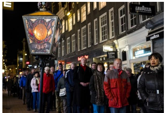
Stille Omgang tijdens het nachtelijk uur in Amsterdam; 2013

Al in het vroege christendom bestond de praktijk om na de eucharistieviering het geconsacreerde brood mee te nemen naar huis voor zieken en stervenden. Het geheiligde brood werd met zorg omgeven, vereerd en aanbeden. De heilige abt Basilius de Grote (ca. 329-379) maakte er een gewoonte van om het geconsacreerde brood in drieën te breken. Een deel at hij zelf, een ander deel gaf hij aan de monniken terwijl hij een derde deel ter aanbidding plaatste in een gouden duivenbeeld dat boven het altaar hing.