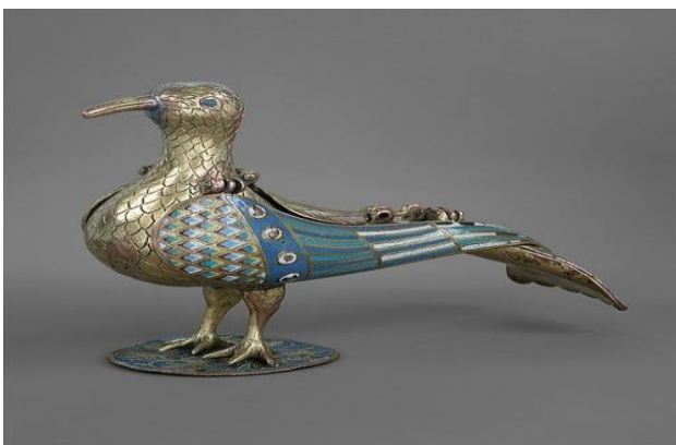
Eucharistische Duif (19 de eeuw), Limoges Frankrijk

Al in het vroege christendom bestond de praktijk om na de eucharistieviering het geconsacreerde brood mee te nemen naar huis voor zieken en stervenden. Het geheiligde brood werd met zorg omgeven, vereerd en aanbeden. De heilige abt Basilius de Grote (ca. 329-379) maakte er een gewoonte van om het geconsacreerde brood in drieën te breken. Een deel at hij zelf, een ander deel gaf hij aan de monniken terwijl hij een derde deel ter aanbidding plaatste in een gouden duivenbeeld dat boven het altaar hing.