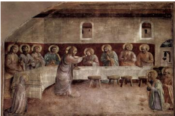
Het Laatste Avondmaal, Fra Angelico (1395-1455)

Pesach is in de eerste plaats het feest waarin de uittocht uit Egypte wordt herdacht. In Exodus 12 lezen we hoe God zelf dit Pascha (= voorbijgaan) instelde. Hoogtepunt van het feest is de maaltijd op de eerste avond, ter herinnering aan de maaltijd aan de vooravond van de uittocht van het volk Israël.