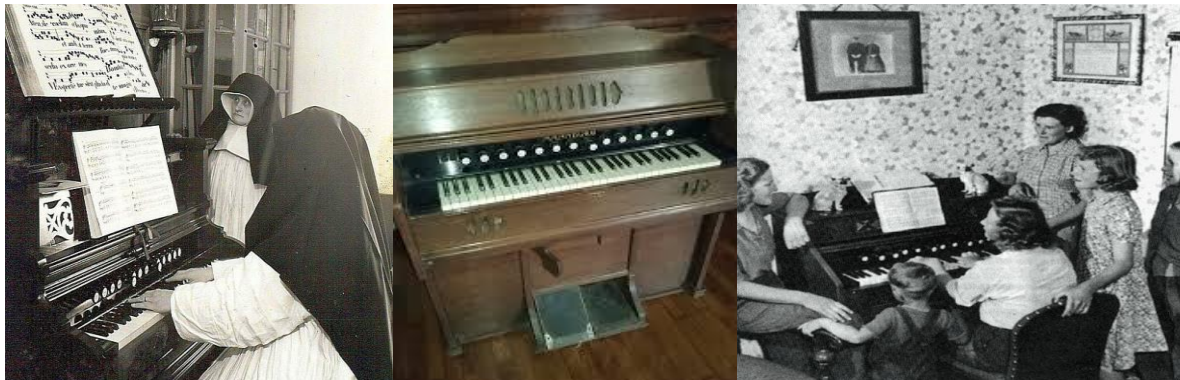
Augustinessen Sint Oedenrode 1954; Mannborg harmonium; Thuis psalmen zingen, een protestantse traditie

De bijnaam 'psalmpomp' kreeg het harmonium in ons land door het feit dat er in bijna elk protestants gezin wel een harmonium te vinden was.