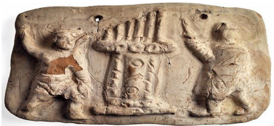
Romeins Waterorgel uit 228 voor Christus

De oudste vorm van een orgel kunnen we vinden zo ongeveer 250 jaar voor Christus in Alexandrië, de hydraulis. Vertaald betekent dit Griekse woord een waterpijp of een waterfluit. Een soort luchtorgel wat terug is te vinden in het hiervan afgeleide woord hydraulica: vloeistofdynamica. In de wetenschap wordt dit vertaald als de beweging (stroming) van vloeistoffen en gassen.