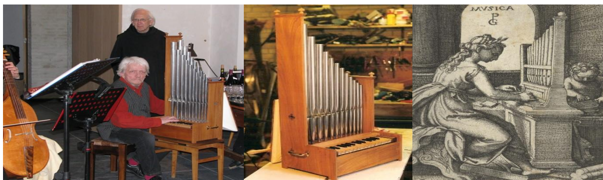
Wielhouwer speelt op zijn portatief; de gevoelige snaren van de vrouw als personificatie van de muziek, 16 e eeuw