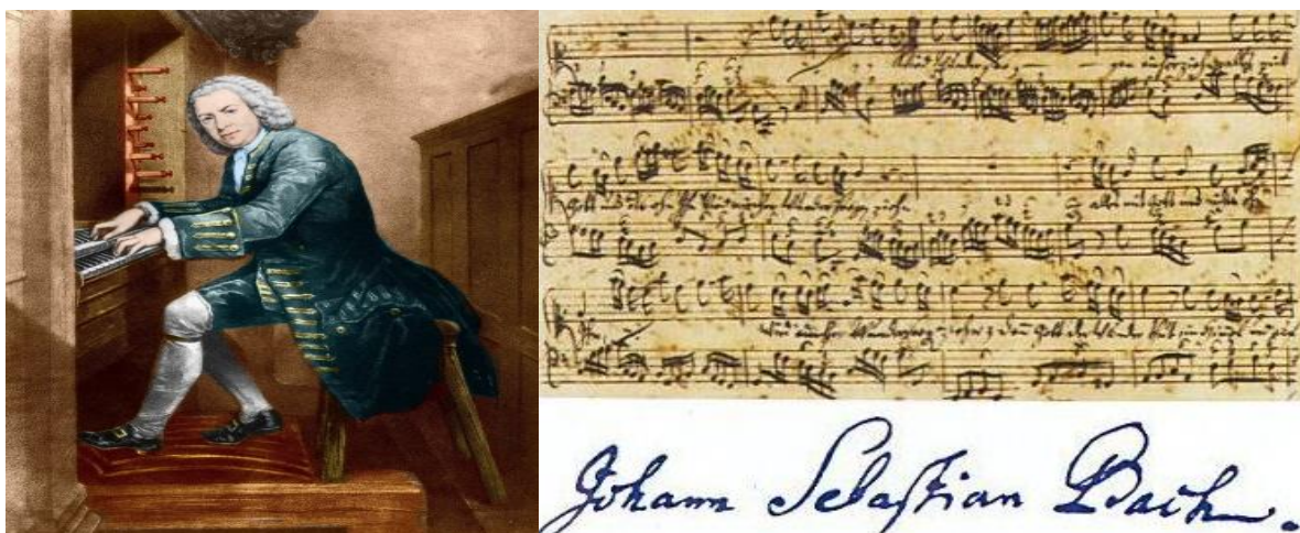
Bach aan het orgel

De voornaamste taak van het kerkorgel was het begeleiden van de volkszang, hoofddoel werd het begeleiden van menselijke stemmen (een koor of solist) en het kerkorgel werd dan ook voor deze taak uitgerust. Tot in onze dagen is dit samenspel tussen orgel en gemeente erg populair. Denk aan de televisie uitzendingen van de Evangelische Omroep met orgel en samenzang 'Nederland Zingt', nog steeds favoriet bij veel kijkers en luisteraars.