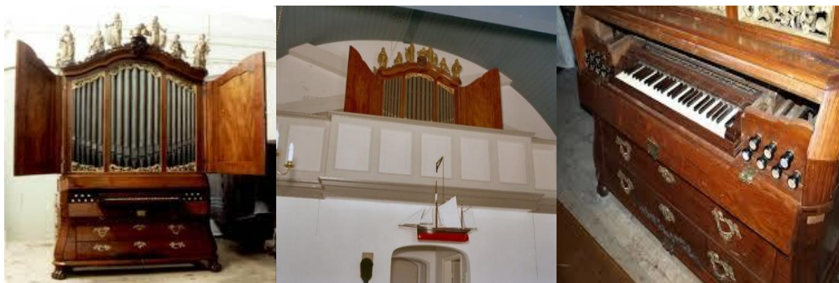
Kabinetorgel uit 1762 in de voormalige Hervormde kerk