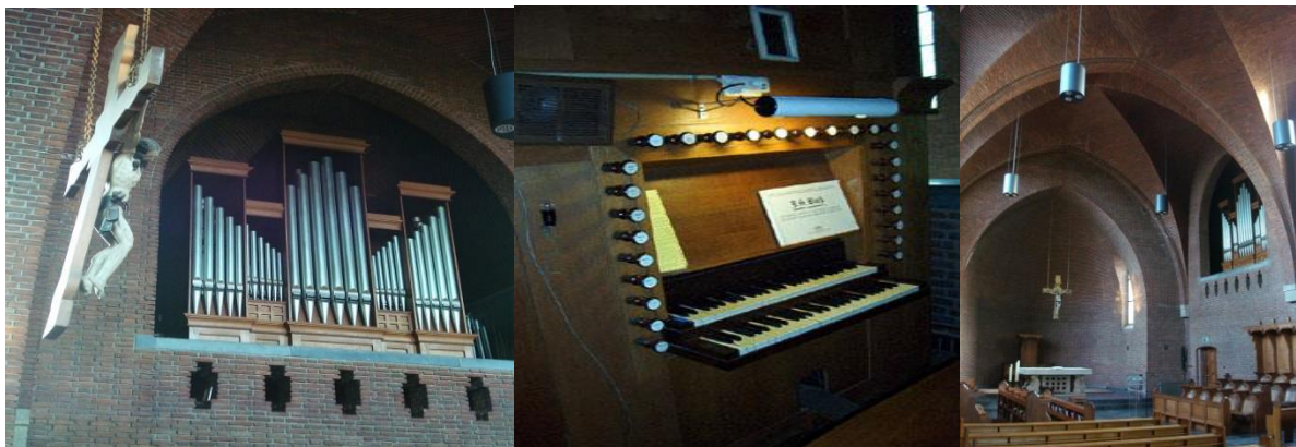
Groot orgel in de abdijkerk

Dankzij een verandering in de overbrenging in 1988 is het orgel, na een kleine gewenning, goed te bespelen. Vóór de aanpassing hadden sommige toetsen een druk van 2 tot 3 kilo nodig om in te drukken zodat de organist dan letterlijk het zweet in de handen stond. De klank van het orgel is aangenaam, de registersamenstelling biedt verrassende mogelijkheden en maakt het tot een genoegen dit orgel te bespelen; de conditie van het instrument is uitstekend en de speelaard plezierig.